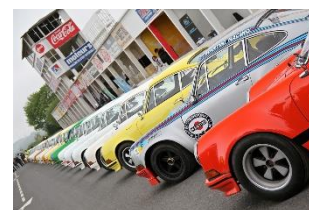
40 ans à Reims Gueux