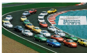
30 ans à Magny-Cours