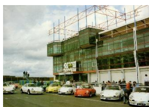
20 ans à Magny-Cours